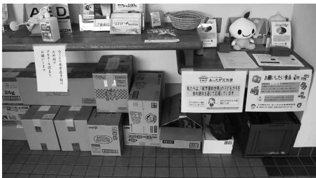
フードドライブでご寄付いただいた食料