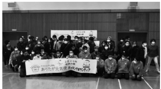
パッキングボランティア