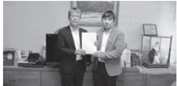
＜産別組織等協力要請行動＞

また、10月7日（月）、中国労働金庫、こくみん共済coop、県労福協3者による各産別組織に向けての協力要請を行いました。